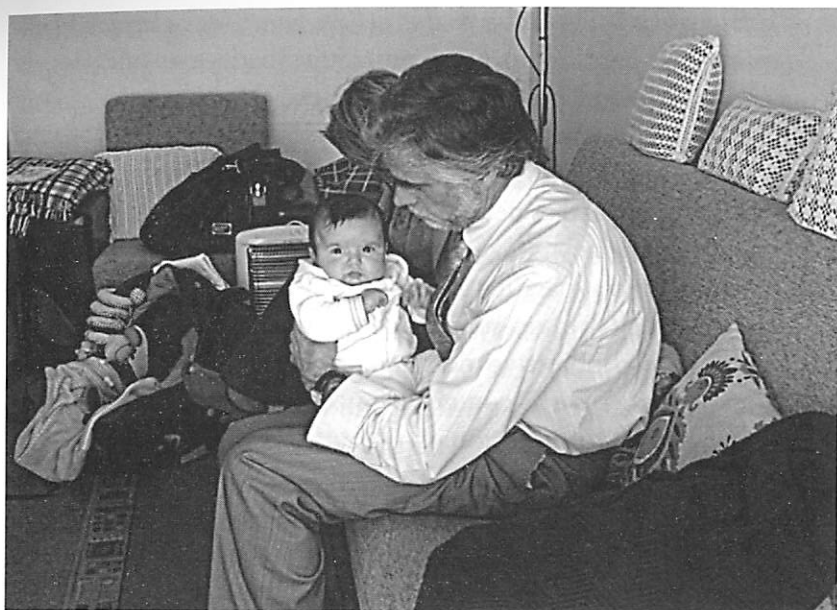
FOTOGRAFIA 3. Avô e neto (Coimbra, Portugal, 2010)

infância, influencia a forma e o estilo como cuidam e educam os seus próprios filhos (Kivnick, 1982, Ramos, 1993, 2002, 2004, Kornhaber, 1996, Castellan, 1998).