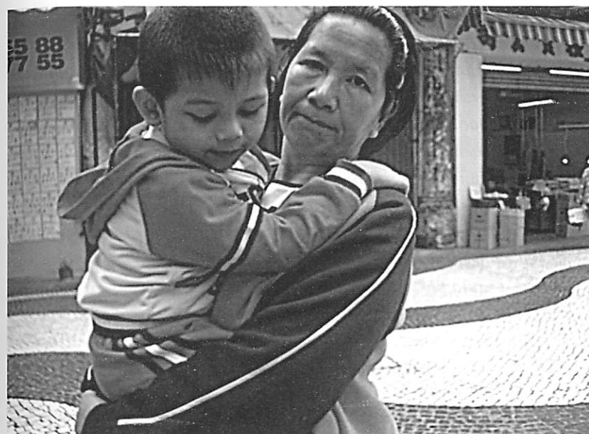
FOTOGRAFIA 5. Avó e neto (Macau, China, 2010)

Para melhor lidar com o envelhecimento populacional, é necessário que os países, nomeadamente os decisores políticos e a sociedade civil, desenvolvam esforços para a implementação de