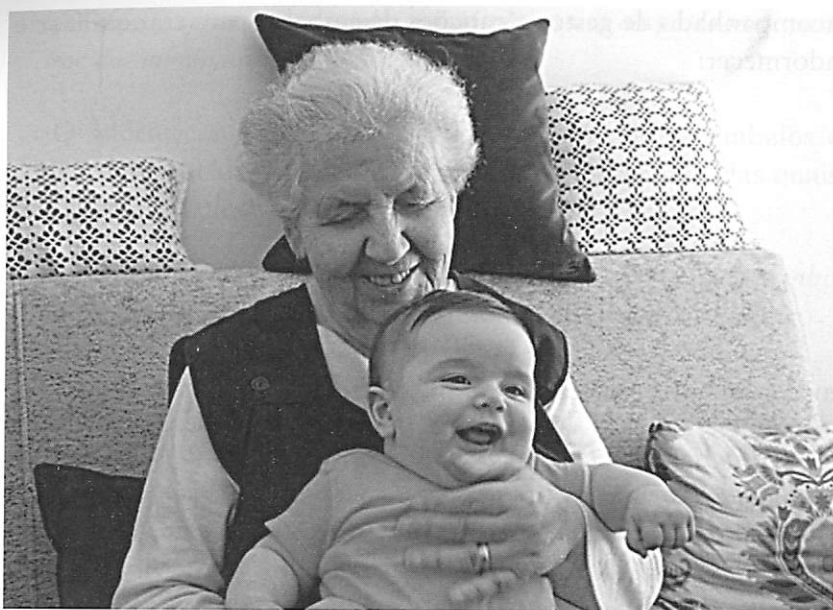
FOTOGRAFIA 4. Avó e neto (Coimbra, Portugal, 2010)