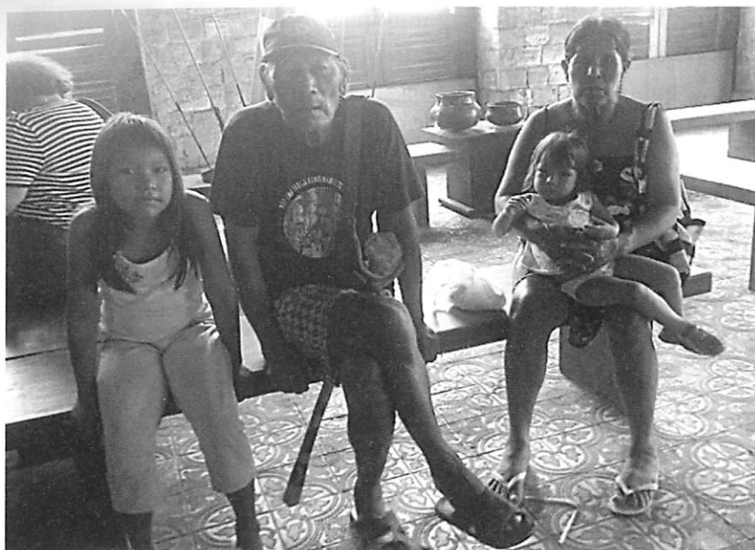
FOTOGRAFIA 2. Avós e netos (Belém, Pará, Brasil, 2010) Autora: Natália Ramos

Portugal constitui um dos países mais envelhecidos da Europa. O Instituto Nacional de Estatística (INE, 2009) regista que a população portuguesa está cada vez mais envelhecida, tendo a esperança média de vida aumentado nos últimos oito anos. Nos próximos 50 anos, manter-se-á a tendência de envelhecimento demográfico em Portugal, estimando-se que em 2060 residam no território nacional cerca de 3 idosos por cada jovem.