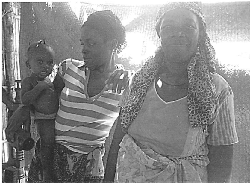
FOTOGRAFIA 1. Gerações em confronto: Avó, filha e neta – Pemba, Cabo Delgado, Moçambique, 2010

de idosos que vivem sozinhos ou em lares, estes factores não eliminaram as solidariedades familiares intergeracionais, nomeadamente, nos cuidados às crianças ou aos idosos, no apoio na doença ou em momentos de crise ou mudança (divórcio, desemprego, migração, maternidade/paternidade na adolescência), não eliminaram o “ altruísmo participativo ” (Moscovici, 2001). O “ altruísmo participativo ” é uma participação intensa à vida em comum, uma dedicação e vínculo a uma comunidade, a um grupo ao qual nos identificámos. É um “ altruísmo sem outro ”, onde o eu e o outro não estão verdadeiramente distintos, o outro constitui o nós que liga os membros da família”, um “ nós familiar ” altruísta e solidário.