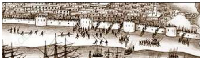
Fig. 6 - Detalhe do ataque a Adem

Gaspar Correia que acompanharia Afonso de Albuquerque 32 como seu secretário elabora uma precisa descrição da cidade e de toda a linha de fortificação da mesma, desenhando o assalto à cidade (fig. 5).