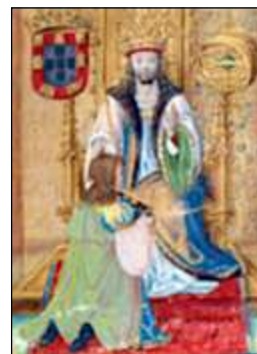
Fig. 2 - Rui de Pina a sua Crónica de D. João II a D. Manuel 9

A esfera, a coroa e o ceptro são os signos que servem a imagem de um monarca, por isso, importa assinalar como numa cópia iluminada, datada de inícios do século XVI 10 e cuja iluminura