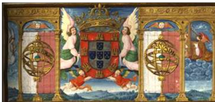
Fig. 1 - Portada do livro 5 de Odiana, leitura Nova 7

a esfera era a forma escolhida pelos matemáticos para representar “toda a máquina do Céu e da terra” 6 . Atente-se como no projecto de concerto e cópia do scriptorium régio manuelino a esfera pontua marcando um reinado e a imagem de um monarca, como acontece, por exemplo, nesta portada do livro 5 de Odiana, Leitura Nova , pairando sobre uma paisagem campestre ladeadas por figuras angelicais.