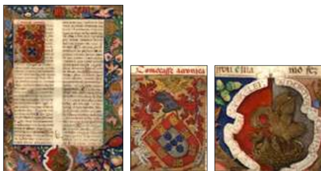
Fig - 3 Armas e empresa de D. João II 12

acompanha o prólogo da Crónica de D. João II , de Rui de Pina, 11 se expõem esses signos e se revela através da postura, expressão facial e posição hierática de D. Manuel, a sua Majestade Régia. Recorde-se que o cronista terminara a escrita desta crónica em 1504.