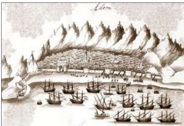
Fig. 5 - Adem nas Lendas da Índia de Gaspar Correia 31

Afonso de Albuquerque, que já servira durante o vice-reinado de Francisco de Albuquerque como capitão-mor da costa da Arábia e que tinha colocado sob protectorado português Ormuz, vai desenvolver como governador da Índia toda uma série de conquistas que visam fortalecer a rede de enclaves estratégicos: Em 1510 toma Goa 30 e em 1511 conquista Malaca, dominando a chave de comércio entre o Índico e o Extremo-Oriente. É exactamente desta praça que são enviadas as expedições comerciais a Banda e Maluco, aí procurando os espaços originários da noz de moscada e do cravo-da-índia, seguindo igualmente as primeiras embaixadas para Java, China, Sião e Pegu. A par destas incursões pelo Extremo Oriente, visava-se fechar / controlar Adem, ainda que não tenha sido possível conquistar esta praça.