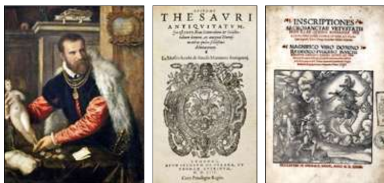
Fig.4 - Retrato de um Jacopo de Strada, por Ticiano (1567–1568) óleo sobre tela, 125 cm x 95 cm, Kunsthistorisches Museum, Viena e frontíspios das suas obras 20

Fernão Lopes de Castanheda, que desempenharia o lugar de bedel na universidade de Coimbra após ter passado cerca de dez anos na Índia 17 convoca Rui de Pina como o cronista que, a mando do seu rei, D. Manuel, tirou em linguagem 18 os quatro versos que teriam aparecido numa inscrição romana, numa praia em Sintra, a praia das maçãs. Para uns, tais inscrições teriam aparecido em 1505, para outros, assim que Nicolau Coelho dera as novas da viagem de Vasco da Gama ao monarca, elas teriam sido descobertas. A inscrição latina proclamaria, na tradução portuguesa, a profecia de Sibila relativamente aos do ocidente, afirmando que serão revoltas as pedras com as letras direitas e em ordem, quando tu ocidente vires as riquezas do Oriente. O Ganges, Indo e o Tejo será cousa maravilhosa de ver, trocando cada um com o outro suas mercadorias. 19