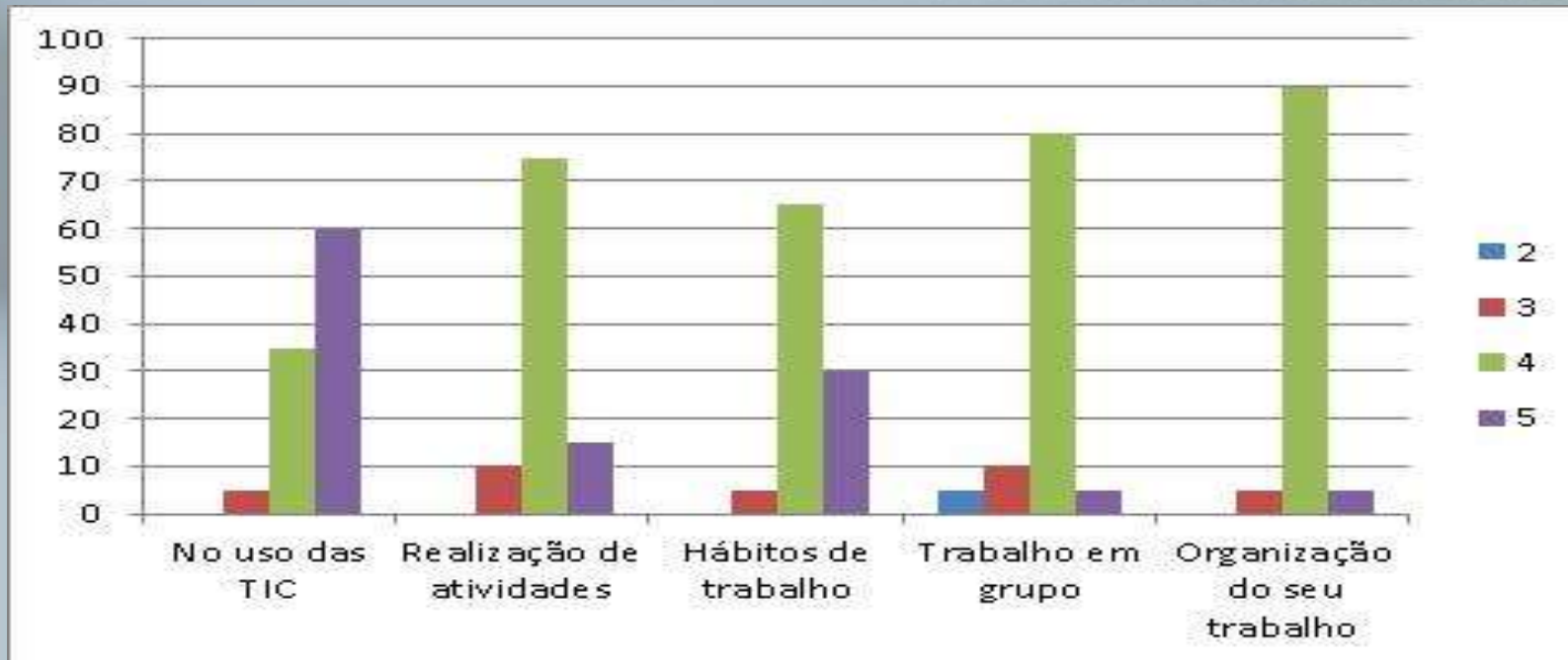
Fig.2 - Avaliação do impacto do Moodle feita pelos alunos.