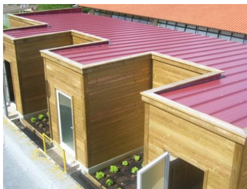
Figura 16: Aldeia sustentável da E.T.E.O.

A Aldeia Renovável é uma instalação que existe na Escola e que surgiu devido à necessidade de educar a comunidade escolar e a população em geral para a aquisição de hábitos conducentes a uma maior sustentabilidade ambiental. Os equipamentos foram construídos com a participação de alguns alunos do Curso Técnico de Energias Renováveis e, atualmente, é onde funcionam as oficinas das aulas práticas do mesmo curso, tendo a particularidade de ser autossustentável em termos energéticos.