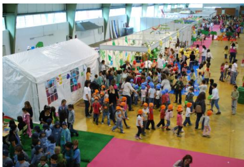
Figura 13: Semana da Criança 2011 - Expoeste

particular. Para ilustrar estes acontecimentos, não posso deixar de referir o importantíssimo papel que a Escola tem tido na animação de grupos específicos, como é o caso das crianças e dos idosos, participando em encontros locais e em instituições da região nas épocas festivas, por exemplo a participação na «Semana da Criança» (certame de animação das crianças das escolas da região em junho, para comemorar o Dia da Criança), no «Natal dos idosos» (festa convívio de diversos lares de 3ª idade do concelho), no «Natal Solidário» (atividade festiva que conta com a participação de várias pessoas de diferentes faixas etárias, proporcionando a vivência do Natal de uma forma solidária) e no «Carnaval do Idoso» (festa organizada pela Câmara Municipal de Caldas da Rainha para proporcionar aos idosos do concelho alguma animação na época festiva que é o carnaval).