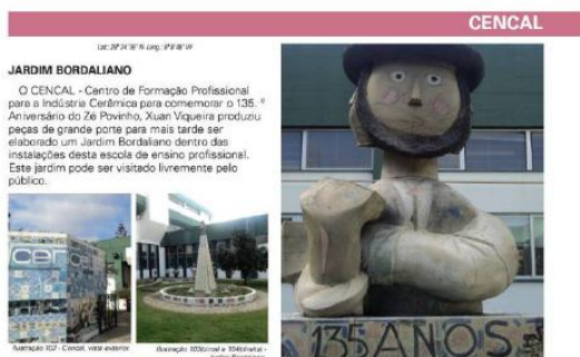
Ilustração 151 - Um dos pontos extra itinerário.