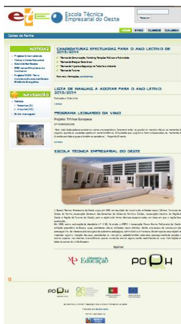
Figura 11: Imagem do site da Escola