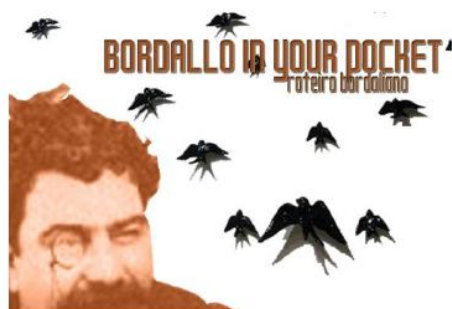
Ilustração 148 - Capa do Bordallo in your Pocket