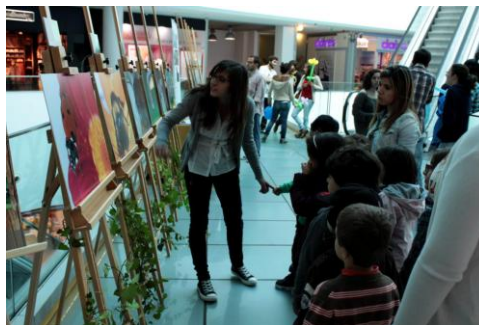
Figura 14: Explicações dadas pela Aluna às crianças do jardim infantil sobre os animais retratados nas fotografias