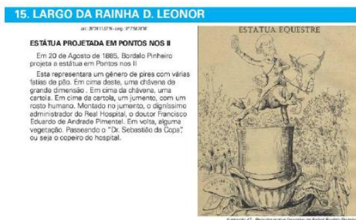
Ilustração 149 - Um dos pontos em que Bordalo Pinheiro faz uma crítica satírica através da caricatura.