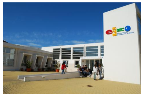
Figura 5: Novo edifício da E.T.E.O

Assim, dando cumprimento aos preceitos legais, a E.T.E.O. foi criada com a finalidade de atingir os seguintes objetivos: