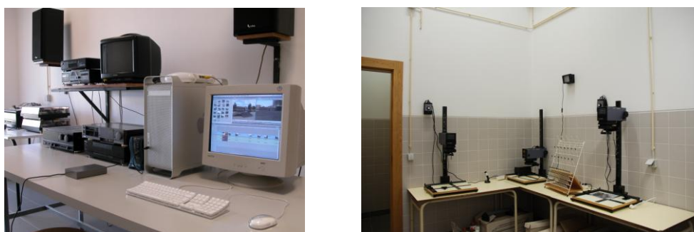
Figura 10: Laboratórios de multimédia e fotografia, respetivamente

de informática e auditório. Naturalmente que estas instalações, que representam um enorme investimento para a Escola, têm uma relação direta com os cursos que as utilizam (nomeadamente, os cursos de técnico de multimédia, fotografia, energias renováveis, termalismo e auxiliar de saúde), revelando-se fundamentais para a formação dos futuros técnicos, pois permitem um contacto com a realidade possibilitando a passagem da teoria à prática. A estas instalações e respetivos equipamentos, têm acesso os alunos e professores no decurso natural das atividades escolares, mediante requisição prévia e individualizada, desde que tal utilização não colida com o normal desenvolvimento das atividades letivas.