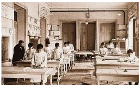
Figura 2: Escola Oficina n.º 1 - Aula de Desenho (1914)

«O estabelecimento de uma aula de instrução primária no Arsenal da Marinha , na qual recebem ensino os numerosos aprendizes que trabalham neste estabelecimento , era uma necessidade. Os operários não podem bem desempenhar os melhoramentos introduzidos em todos os artefactos aplicáveis ao serviço da marinha, sem que tenham os indispensáveis princípios elementares. Neste propósito acha-se já funcionando umas aulas de instrução primária, dirigida por um hábil professor indicado como próprio para esse mister pelo comissário dos estudos nesta capital. A dita aula tem sido frequentada por perto de 160 alunos, os quais, na sua maioria, pertencem ao Arsenal da Marinha, e alguns deles, não poucos têm dado suficientes provas de aproveitamento».