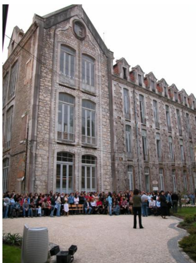
Figura 4: Edifício antigo da E.T.E.O. - Pavilhões do Parque D. Carlos I

proporcionado condições para criar uma «família» que construiu e desenvolveu laços que perdurarão para sempre nos corações de cada um, digna da magnificência do próprio edifício que ainda hoje existe. Desta forma, a degradação natural que o passar dos anos trouxe, impulsionou a construção de um novo espaço para a escola funcionar: no ano de 2005 foi construído de raiz um edifício moderno, com as características adequadas ao funcionamento de uma escola em expansão, local onde ainda hoje se mantém, tendo a obra sido financiada pelo FEDER (Fundo Europeu de Desenvolvimento Regional) e, maioritariamente, pela Câmara Municipal de Caldas da Rainha. Como disse a responsável pelo GOAIMT, «Com a mudança de instalações, foi possível a escola crescer, dar o grande salto e atualmente estamos na capacidade máxima, temos 15 turmas, 5 em cada ano, portanto estamos no nosso limite em termos de capacidade de alunos.».