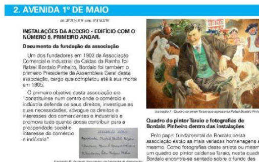
Ilustração 152 - Um dos primeiros pontos do itinerário.