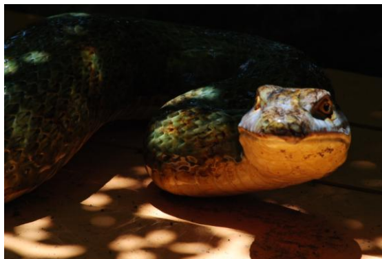
Figura 18: Melhor fotografia individual - II Maratona Fotográfica (2013)

A título de exemplo, segue-se uma das fotografias premiadas: