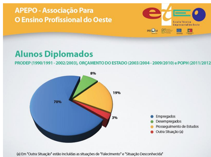
Figura 9: Representação gráfica da situação dos alunos diplomados pela Escola desde 1990 até ao ano letivo de 2011/2012