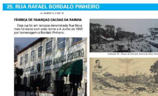
Ilustração 150 - O Ponto final do itinerário, Fábrica de Faianças das Caldas da Rainha.

Figura 4: Ilustrações do Roteiro Bordaliano elaborado pela Aluna