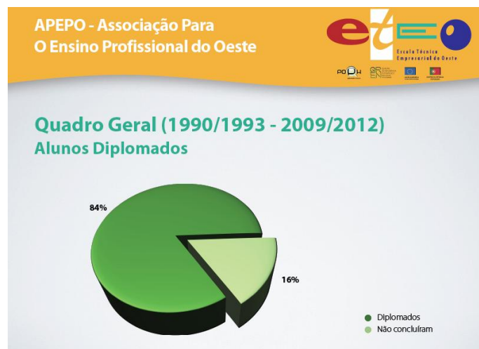
Figura 12: Percentagem dos alunos que concluíram o curso desde o início da Escola

a escola começou a sua atividade (1990) até aos nossos dias (ano letivo transato), correspondendo a mesma a 84%. Ou seja, dos 1208 alunos que concluíram os 3 anos de formação, diplomaram-se 1009, correspondendo estes a técnicos qualificados: