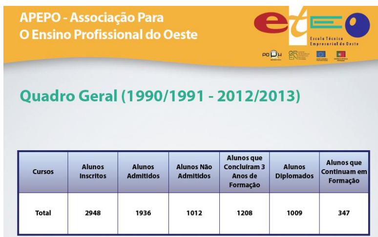
Figura 6: Quadro Geral representativo do número de alunos que passaram pela Escola

Até ao ano letivo transato a Escola já diplomou mais de 1000 alunos, de um total de 1208 que concluiu o respetivo triénio, conforme demonstra o quadro síntese que se segue, elaborado pelo GOAIMT. Este quadro é intitulado de «Quadro Geral» porque engloba todos os alunos que já passaram pela Escola, inclusivamente os que fizeram cursos no regime de aprendizagem em parceria com o Instituto de Emprego e Formação Profissional. Ou seja, dos 2948 alunos que até hoje se inscreveram na Escola, só 1936 foram admitidos e frequentaram um curso profissional na E.T.E.O.. Dos 1936 alunos que foram admitidos a frequentar a Escola, só 1208 terminaram o ciclo de formação (o triénio do respetivo curso); destes 1208 alunos diplomaram-se 1009, o que nos leva a concluir que, para além dos 347 alunos que ainda continuam em formação, houve apenas 381 alunos que ao longo do tempo de existência da escola não teve sucesso, quer seja por terem sido excluídos, por desistirem de estudar ou porque foram para outra escola.