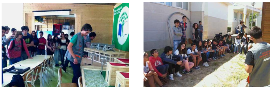
Figura 17: Alunos do Curso Técnico de Energias Renováveis durante as explicações dadas a escolas que visitaram a «Aldeia»

Para além das especificidades próprias de laboratórios desta natureza, a «Aldeia» está à disposição da comunidade em geral, e da Escola em particular, para poder ser visitada por todos aqueles que querem aprender mais sobre as energias renováveis e a importância da sustentabilidade.