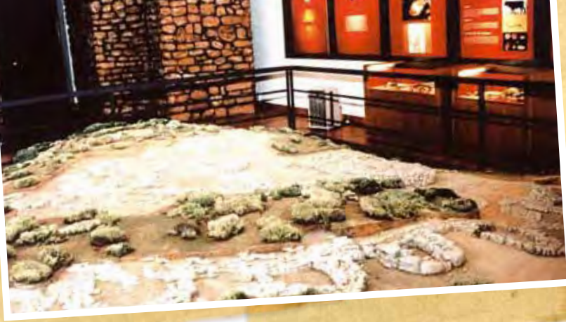
Aspecto parcial da Exposição Permanente de Arqueologia, alusiva ao povoado pré-histórico de Leceia, patente ao público na Fábrica da Pólvora de Barcarena desde 1998.

Partial view of the Permanent Archaeology Exhibit dedicated to the pre-historic settlement of Leceia, available to the public at the Fábrica da Pólvora de Barcarena since 1998.