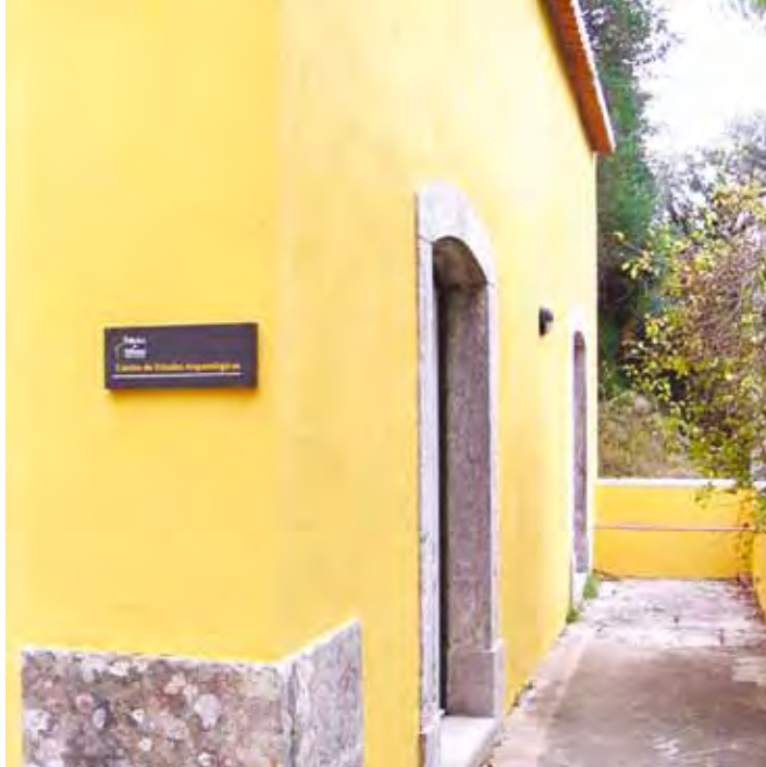
Vista parcial do piso térreo do edifício do Centro onde se encontra instalado o Laboratório e o Depósito de Materiais Arqueológicos.

Partial view of the ground floor of the building where the Centre has its Lab and its Storage Room for Archaeological Findings.