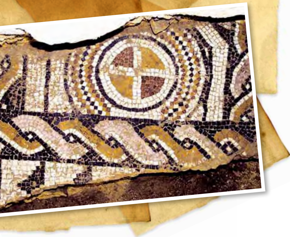
Vista parcial das escavações realizadas em 2006 em sector da villa romana de Oeiras. Observa-se parte do mosaico policromado figurativo, cuja parte principal fora posto a descoberto em 1903, bem como diversas estruturas subjacentes, da Idade do Ferro.

Partial view of the excavations carried out in 2006 at a section of the Roman villa in Oeiras. You can see some of the figurative multicoloured mosaic, the main part of which had been uncovered in 1903, as well as various underlying structures dating back to the Iron Age..