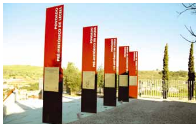
Vista do arranjo da entrada do povoado pré-histórico de Leceia, inaugurada em 2003, com painéis explicativos servindo como introdução aos visitantes do espaço arqueológico.

• a intervenção nas “Ferrarias d’el Rey”, na zona norte da Fábrica da Pólvora de Barcarena, onde foi possível identificar o antigo edifício das ferrarias, fundado no século XV e anterior à Fábrica da Pólvora, cujo valor arqueológico-patrimonial justifica uma acção de maior fôlego, na sequência dos trabalhos realizados entre 2005 e 2007, que prosseguiram em 2009 com excelentes resultados, antecedendo a recuperação de toda a área envolvente. Com