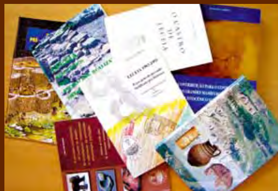
Algumas das publicações de temática arqueológica realizadas pelo Centro. Some of the Centre's publications on the subject of archaeology.

A diversidade de publicações de carácter arqueológico promovidas pela Câmara Municipal de Oeiras através do Centro de Estudos Arqueológicos do Concelho de Oeiras, tem antecedentes. Data de 1982 a primeira publicação editada pela Autarquia, da autoria do signatário deste artigo, dedicada a tema de Arqueologia, no caso o povoado pré-histórico de Leceia.