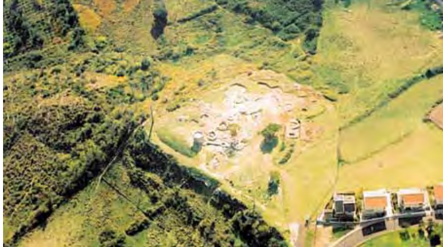
Vista aérea do povoado pré-histórico fortificado de Leceia, cujas escavações se desenvolveram ao longo de vinte anos (1983-2002), conduzindo à identificação integral de um vasto povoado fortificado calcolítico, de importância científica e patrimonial internacional.

Bird's-eye view of the fortified pre-historic settlement of Leceia, where excavations were carried out over the course of twenty years (1983-2002), leading to the complete excavation of a vast fortified settlement dating back to the Chalcolithic period of international scientific and historical import.