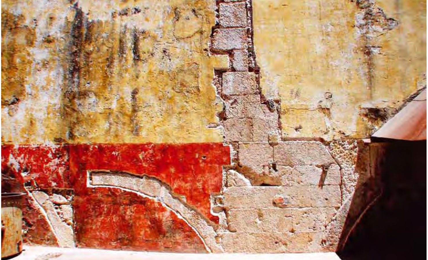
Aspecto dos trabalhos conducentes à identificação de diversas fases construtivas no edifício das antigas "Ferrarias d'El Rey", em 2007, com base em planta de Leonardo Turriano, que se manteve inédita até 2005, ano em que foi publicada, por J.L. Gomes e pelo signatário.

A view of the work that led to the identification of the various building stages of the building that used to house the old "Ferrarias d'El Rey," in 2007, after the site was identified as such based on a draft by Leonardo Turriano, which remained undisclosed until 2005, when it was published by J.L. Gomes and the author of this feature.