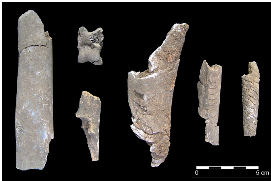
Fig. 5 – Materiais ósseos provenientes da Sepultura 3. À esquerda e ao centro, fragmentos de diáfises de fêmures de boi doméstico ( Bos taurus ), com marcas de fogo evidentes (escurecimento e estalamento); astrágalo e cúbito de caprino ( Ovis aries/Capra hircus ), aquele com marcas de fogo (escurecimento); e dois ossos longos inclassificáveis, com intensas marcas de fogo por estalamento.