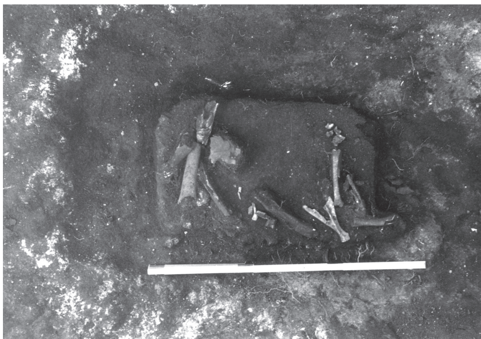
Fig. 7 – Materiais ósseos provenientes do estrato de cinzas sob o murete separador EII-FII (Paixão, 2014, Fig. 14).