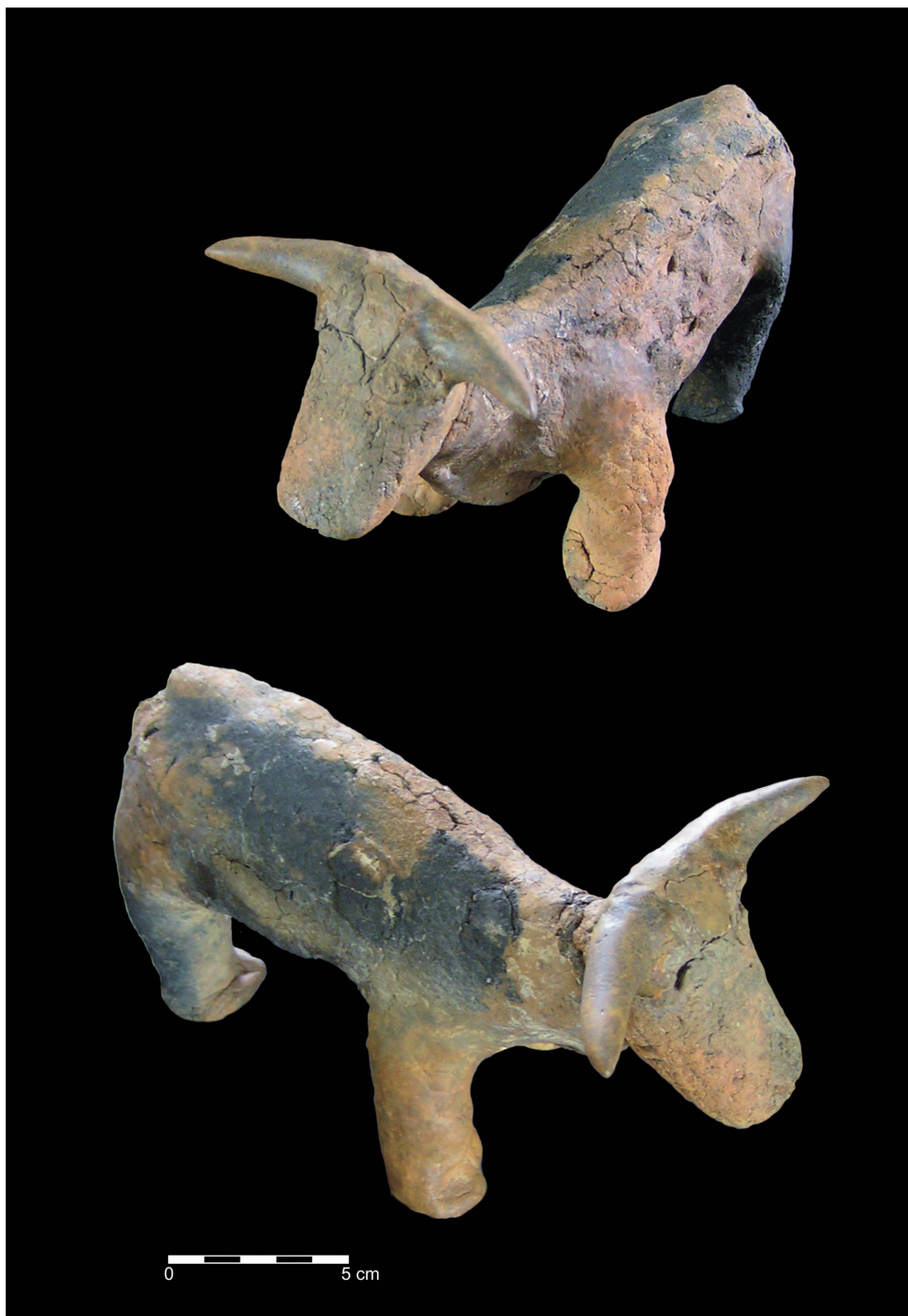
Fig. 9 – Estatueta de bovívdeo de terracota, da necrópole do Olival do Senhor dos Mártires (Foto J. L. Cardoso).