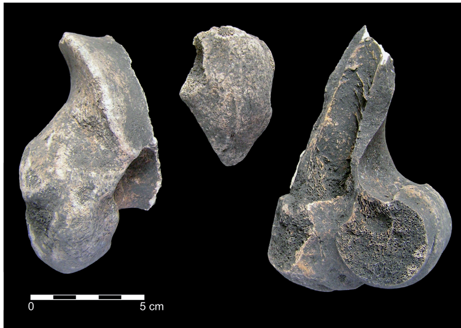
Fig. 4 – Conjunto de restos de boi doméstico ( Bos taurus ) proveniente de uma sepultura. Em cima, rótula; à esquerda, extremidade articular distal incompleta de fémur; à direita, extremidade articular distal de úmero, seccionada verticalmente por cutelo (Foto J. L. Cardoso).