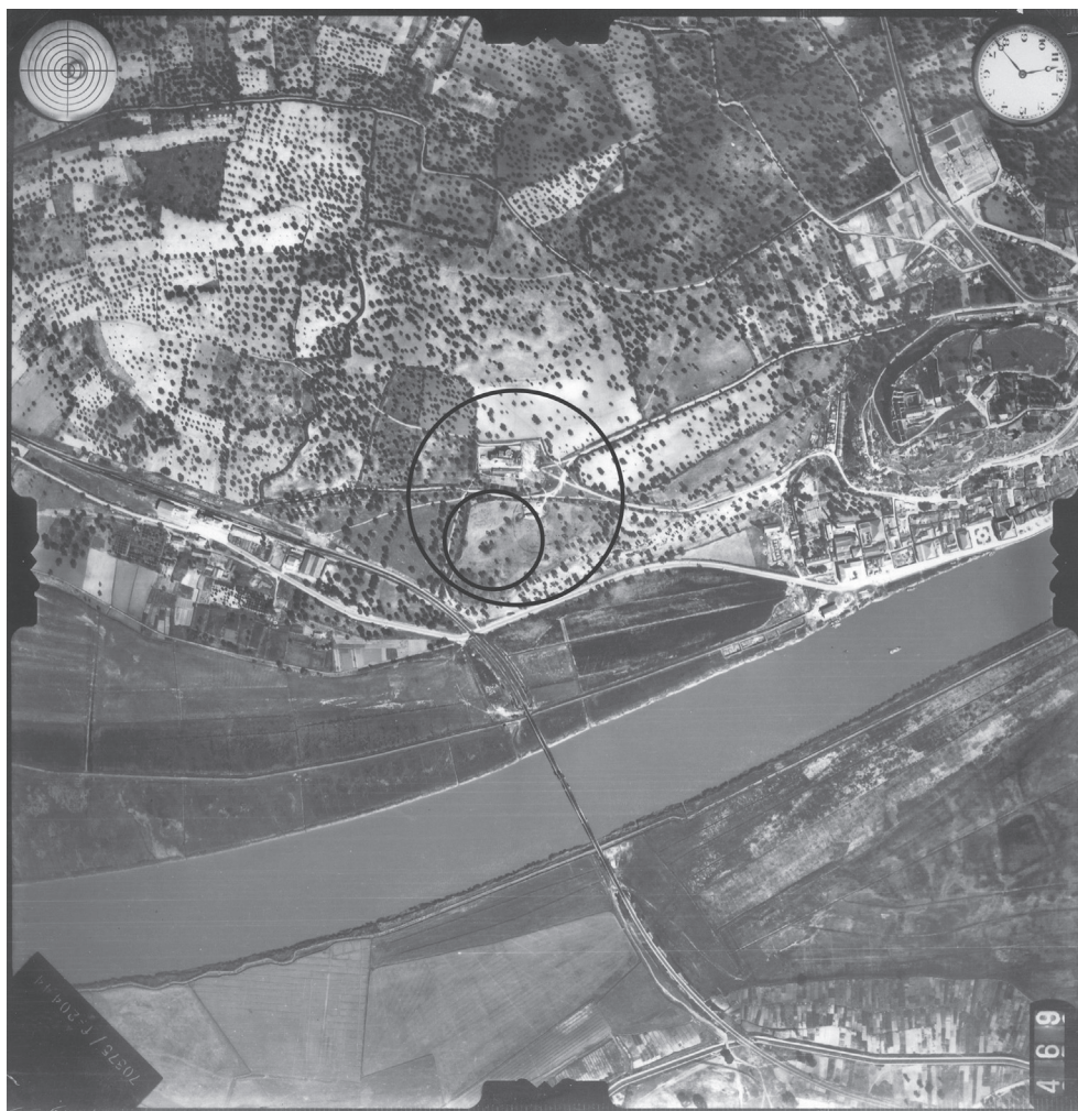
Fig. 1 – Fotografia aérea com a localização estimada da necrópole do Olival do Senhor dos Mártires (círculo maior) e com a localização a área investigada por A. C. Paixão (Paixão, 2014, Fig. 1).