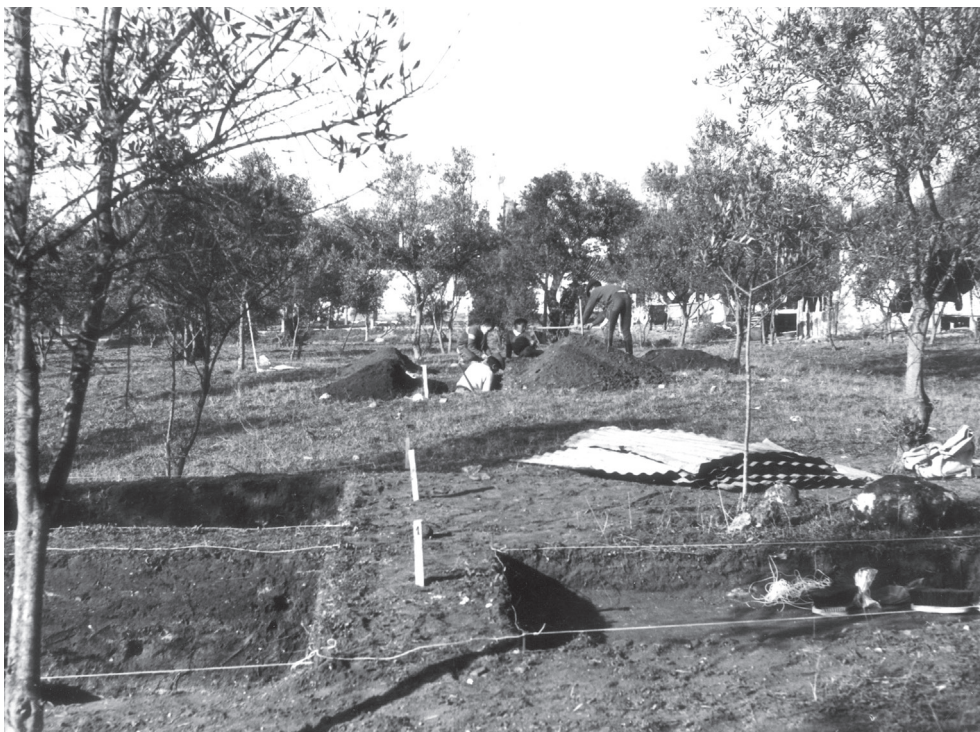
Fig. 2 – Vista parcial das escavações efectuadas por A. C. Paixão na necrópole do Olival do Senhor dos Mártires, no final da década de 1960 (Paixão, 2014, Fig. 4).