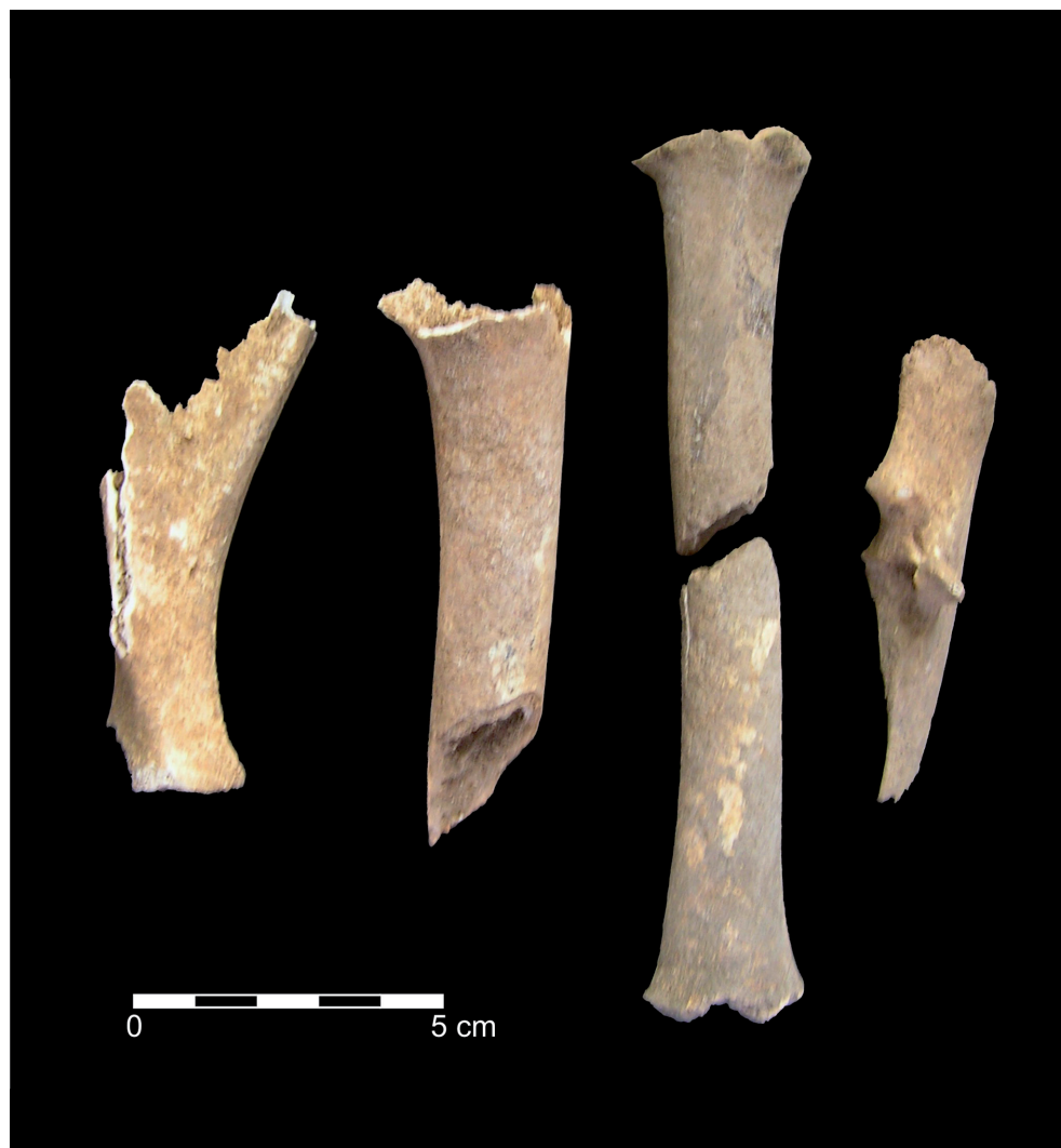
Fig. 8 – Materiais ósseos provenientes do local da foto anterior. Da esquerda para a direita: fragmentos de omoplata, de cúbio, de rádio e de úmero de caprino ( Ovis aries/Capra hircus ).