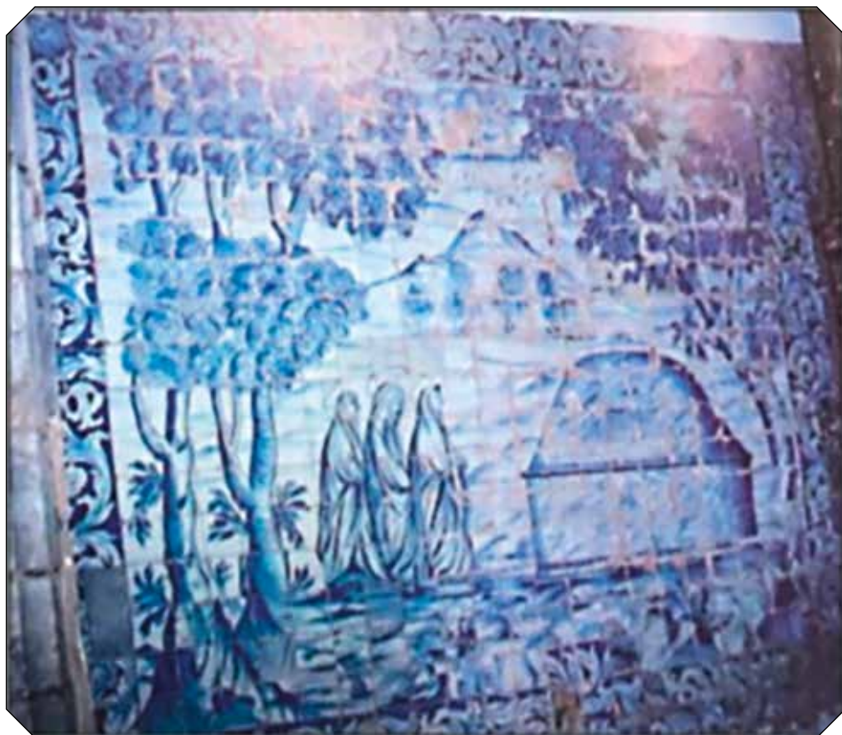
Painel de azulejo - Três Marias junto ao Túmulo de Cristo.