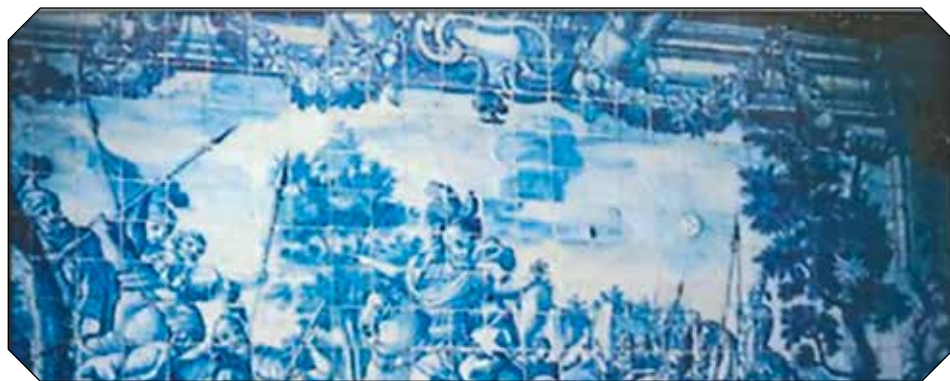
Igreja Matriz de Olivença (Santa Maria do Castelo), painel de azulejo - Josué fazendo parar o Sol .

Nesta última cena, chamamos particular atenção para a reprodução dos modelos, que encontramos das fontes de inspiração ou seja o problema da citação, uma questão fundamental do processo artístico da obra de azulejaria. [Fig. 7]