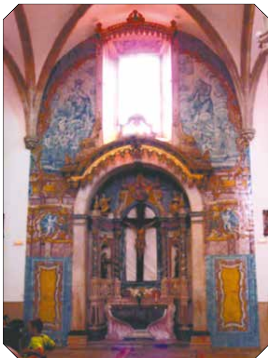
Igreja de Santa Madalena. Altar das Almas do Purgatório.

Avançando para o 2º quartel do século XVIII, encontramos neste monumento, a rodear o Altar das Almas, azulejos já de gosto rococó com cercaduras polícromas: do lado esquerdo Nossa Senhora do Carmo e do lado direito São Francisco, ambos salvando as almas do Purgatório. Em baixo encontramos estruturas arquitetónicas polícromas com anjinhos. Aqui a policromia dos azulejos está relacionada com a diversidade das cores que surgem no interior do retábulo marmóreo. [Fig.5]