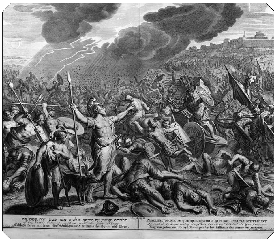
Gravura de Gillen van der Gouwen, A Batalha entre Joshua e os cinco Reis , 1728, 35,5 x 43 cm, Collection Gelonch Viladegut.

Para além da análise da cópia e da colagem mais ou menos fiel nesta circulação e transferência de modelos entre a gravura e o azulejo, interessa igualmente realçar a força destas imagens constituindo um referente cultural, uma fonte de informação e de conhecimento sucessivamente reeditada e actualizada conforme o seu respectivo uso.