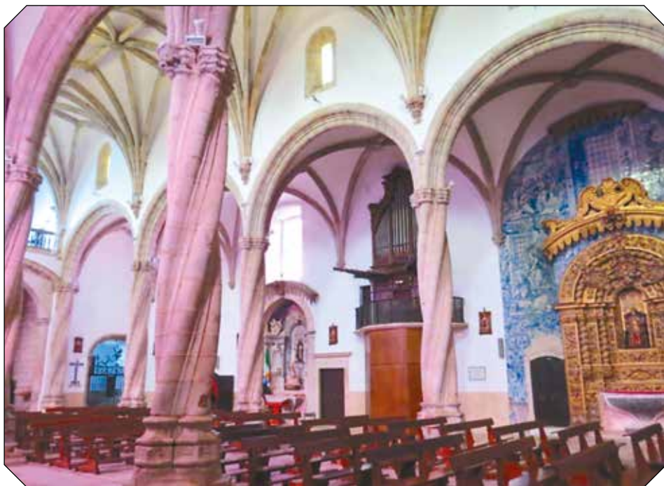
Fig. 1 - Igreja de Santa Maria Madalena, nave central.

O recheio azulejar deste interior, de enorme plasticidade abrange várias fases do barroco (de que referiremos alguns exemplos) revestindo abundantemente as paredes da nave central numa escala integral e a zona da capela –mor em com diferente iconografia.