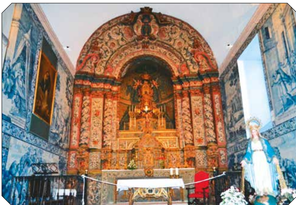
Presbiterio de la ermita del Espíritu Santo (Olivenza) / Presbitério da ermida do Espírito Santo (Olivença)

Museo etnográfico extremeño González Santana Olivenza. 29/30 de noviembre de 2019