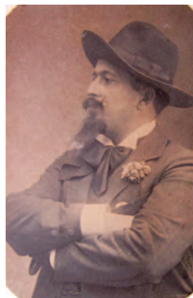
Retrato de Jorge Colaço, 1905

A Câmara Municipal de Loures através do Museu de Cerâmica de Sacavém promove e associa-se às Comemorações dos 150 anos do nascimento de Jorge Colaço , com a organização de uma conferência, a apresentação de uma mostra documental, um diaporama, e duas palestras noutros museus, principalmente a partir de uma seleção de correspondência do Arquivo Empresarial Fábrica de Loiça de Sacavém existente no acervo do Museu, que informa a presença de Jorge Colaço na Fábrica de Loiça de Sacavém no primeiro quartel do século XX e, que agora, também se fixa neste texto.