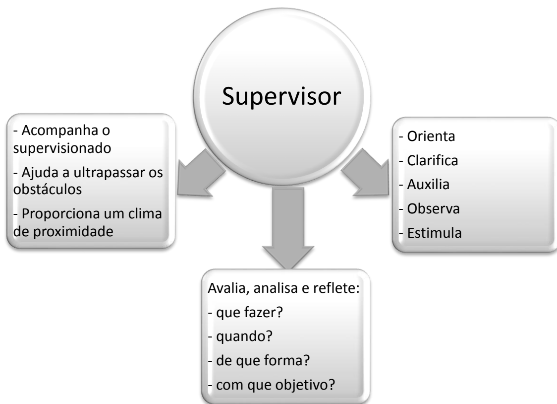
Figura 1.2: O Papel do Supervisor

Tal como apresentado na figura 2.2, de forma a criar uma boa dinâmica de supervisão, os supervisores não só precisam ter boas competências técnicas e observacionais, mas também boas capacidades interpessoais, capacidade para criar confiança e uma atitude