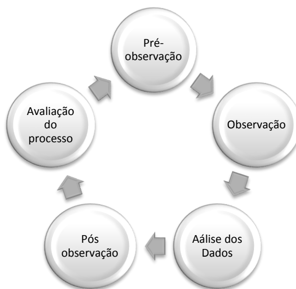
Figura 1.1: Ciclo de Supervisão

É importante que no processo supervisivo exista um clima de diálogo, de interpretação e análise dos fenómenos entre os sujeitos e é neste sentido que tomamos como referência o ciclo de supervisão apresentado por Alarcão & Tavares (2003), composto por cinco fases: encontro pré observação; observação propriamente dita; análise dos dados; encontro pós observação; e, por último, a análise e avaliação do processo realizado e dos efeitos obtidos, que por sua vez abre caminho a um novo ciclo supervisivo, como podemos visualizar na figura 2.1 apresentada: