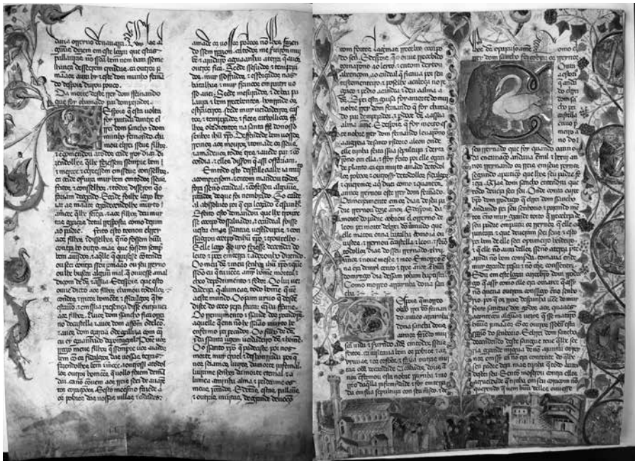
Imagens 1-2 – ff. 198v-199r do ms. 1 Azul da Academia das Ciências de Lisboa