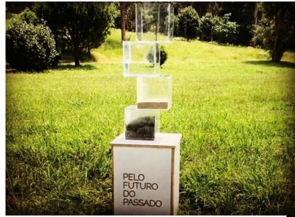
Figura 2 - Representação física dos 4 elementos da natureza.

Ao provocar-nos, ao fazer-nos perguntas, estamos a vivenciar uma experiência artística. O Foco está nos 4 elementos – TERRA, ÁGUA, AR, FOGO sobre a forma real e virtual. A obra é composta por quatro bases e sobre cada uma existe uma caixa em acrílico preenchida com terra, água, cinzas (para representar o fogo) e a última vazia (representa o ar). A obra é enigmática e tem o poder de incitar o observador à reflexão, interrogação, interpretação e inquietude. A posição dos motivos provoca uma reflexão e o desejo de querer saber mais, questionando e estimulando o nosso pensamento e a nossa imaginação de forma a causar perplexidade ou inquietação. Deste modo, a obra não se limita a responder a perguntas, mas a colocá-las. Com a pureza das suas formas, intrigantes e convida-nos a andar em seu redor, a tentar descortinar os seus