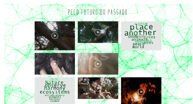
Figura 3 - Interface do ambiente virtual da instalação audiovisual interativa, Pelo Futuro do Passado.

A instalação audiovisual interativa oferece uma interface intuitiva que inclui vários vídeos de curta duração (figura 3).