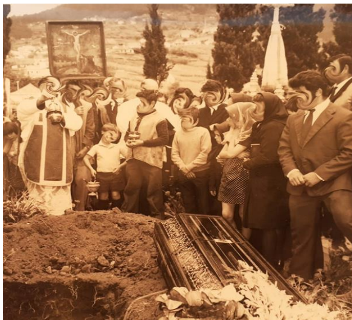
Figura 17: Funeral nos Canhas, com várias crianças em primeiro plano

As figuras 17 e 18 representam cenas de um funeral. Nelas, surgem várias crianças, num primeiro plano. É possível ainda observar nas mesmas a presença do quadro da Paixão de Cristo, um dos artefactos que, normalmente, acompanhavam a procissão do funeral na freguesia: