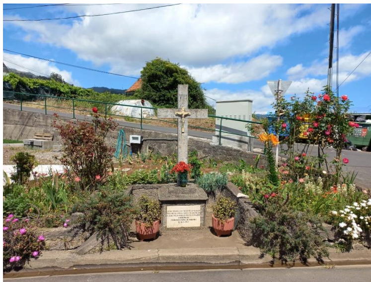
Figura 7: Uma das cruzes da Via Sacra dos Canhas