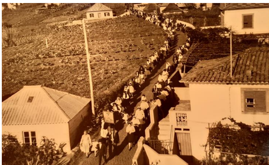
Figura 21: Pormenor de um funeral de uma pessoa nova ou solteira nos Canhas

Na figura 21, é possível observar a procissão de um funeral, onde se pode perceber tratar-se de um funeral de alguém jovem ou de alguém solteiro pela predominância de roupas brancas: