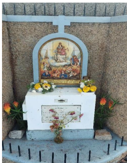
Figura 24: Caixinha das almas, localizada na estrada regional 222

“Falando nas almas, também as pessoas tem devoção às almas e na caixinha das almas deitam a sua oferta. Quando o correio era do outro lado, as pessoas deitavam mais dinheiro, agora que mudou para este lado, as pessoas passam menos lá e há menos dinheiro. As pessoas iam levantar o dinheiro da reforma e depois sempre deitavam uma esmolinha, agora já não passam lá. Depois era celebrada uma missa pela intenção das pessoas que deram a esmola.” (E4)