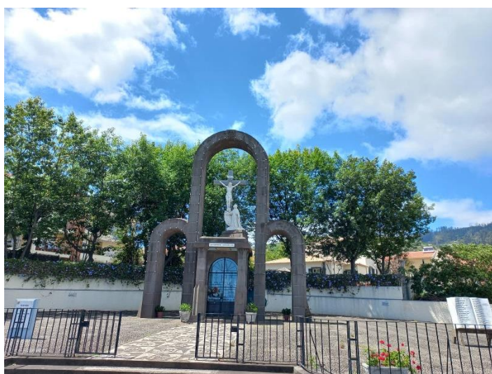
Figura 8: Monumento de Santa Teresinha do Menino Jesus