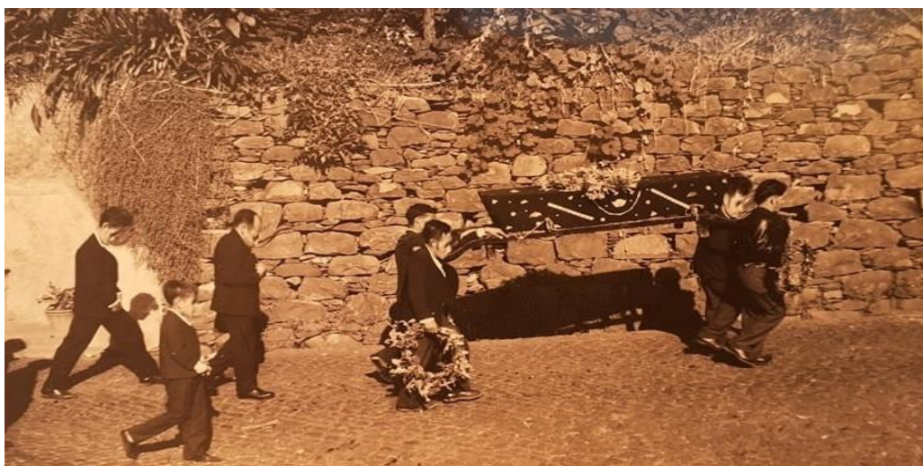
Figura 11: Funeral nos Canhas, pormenor do caixão forrado a preto com estrelas