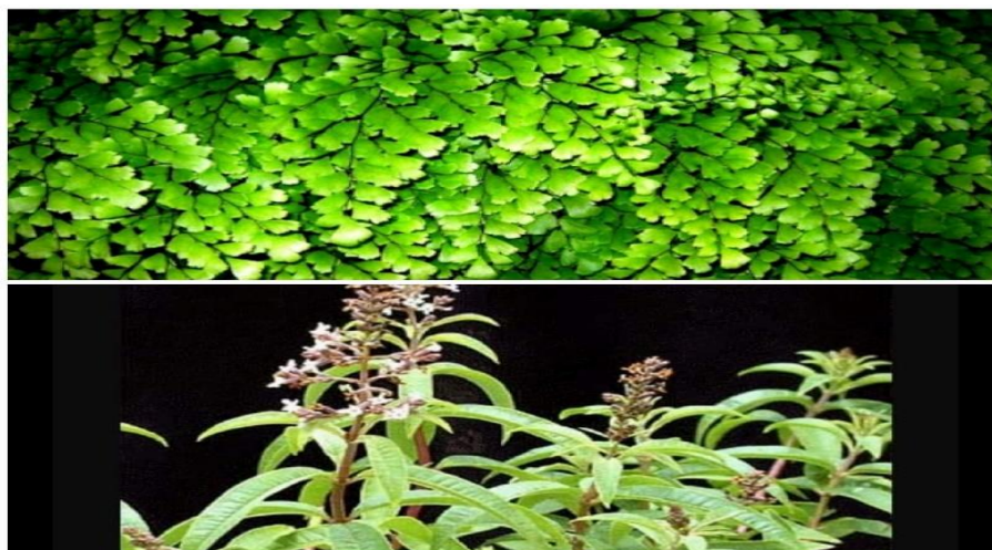
Figura 13: Avenca e flor de pessegueiro

Os caixões eram igualmente decorados com elementos naturais, muitas plantas e flores, especialmente com uma planta chamada avenca (a que os entrevistados referem como venca ) e flores de pessegueiro, que eram associadas aos mortos, por serem utilizadas nos funerais e possuírem um cheiro característico (figura 13).