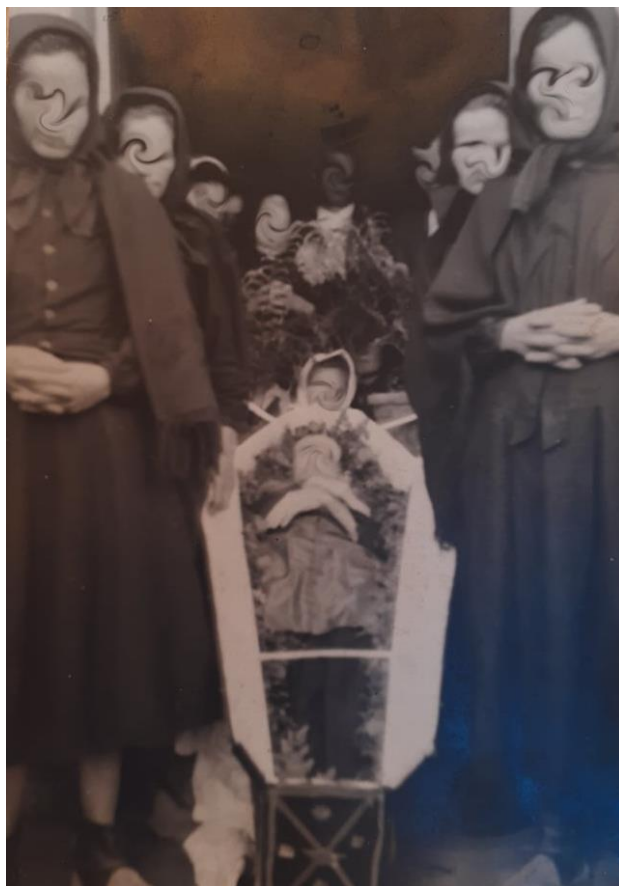
Figura 20: O luto usado pelas mulheres dos Canhas