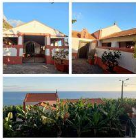
Figura 4: Capela da Nossa Senhora dos Anjos

1474 e de arquitetura maneirista de planta retangular, contém as imagens do Sagrado Coração de Jesus, Nossa Senhora dos Anjos e Nossa Senhora do Desterro (figura 4).