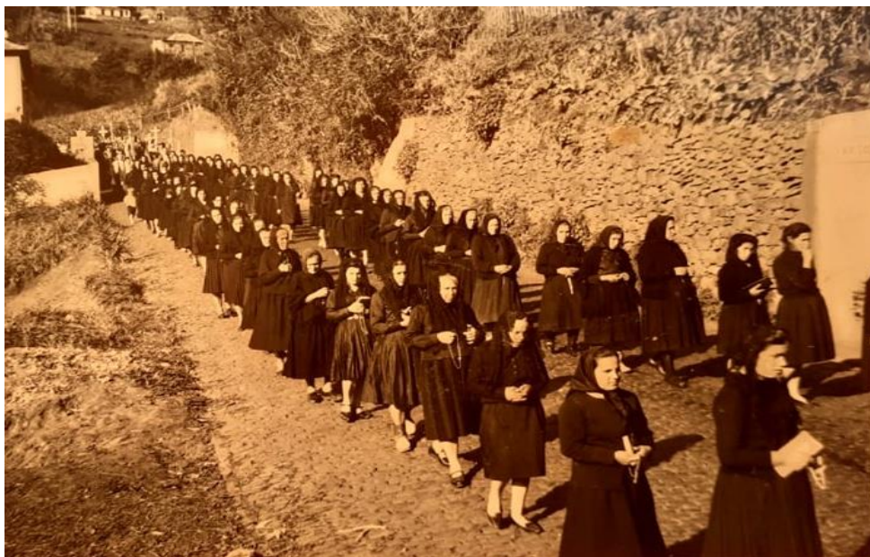
Figura 16: Mulheres de luto, duas a duas, num funeral da freguesia dos Canhas