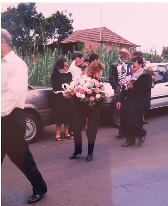
Figura 22: As flores nos rituais fúnebres da atualidade

Na figura 22, também é possível observar os participantes da cerimónia levarem flores para prestar uma última homenagem à pessoa falecida: