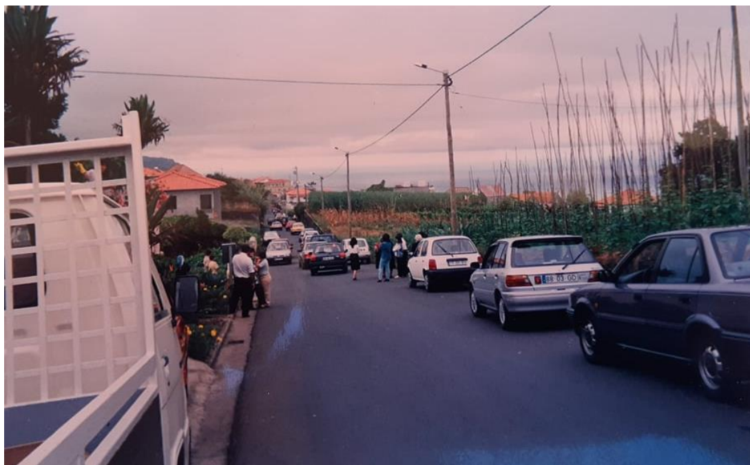
Figura 23: Cortejo fúnebre, nos Canhas, nos anos 90

Na figura 23, é possível observar um desses cortejos fúnebres: