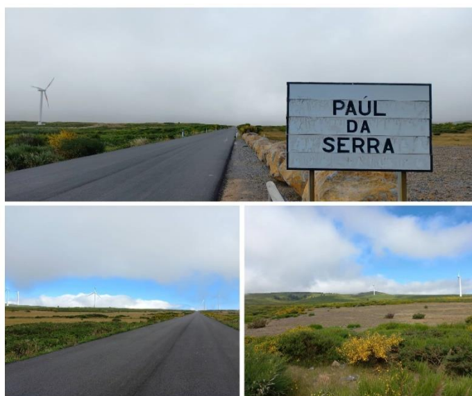
Figura 3: Paul da Serra

A paisagem dos Canhas faz desta uma freguesia singular em toda a ilha da Madeira. Esta surge entre o mar, elevando-se até ao único planalto da ilha, o Paul da Serra. Trata-se da única planície existente na ilha (figura 3), para além de ser o seu mais importante recurso hídrico, que alimenta as ribeiras madeirenses, utilizadas para irrigação. Dado o clima extremo que aí se verifica, o Paul da Serra e a freguesia dos Canhas são frequentemente fustigados por temporais, sob a forma de elevada precipitação.