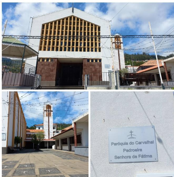
Figura 6: Exterior da Igreja de Nossa senhora de Fátima - Carvalho

No cimo da freguesia, fica localizada a Igreja de Nossa Senhora de Fátima na paróquia do Carvalho. A paróquia foi criada pelo decreto de 30 de novembro de 1960, do bispo do Funchal D. Fr. David de Sousa. Para a sua edificação foi usado o terreno em que em 1744 tinha sido construída a capela de Santo André Avelino. A Capela foi demolida em 1961 e em 1962 iniciaram-se as obras de construção da atual igreja paroquial e Nossa Senhora de Fátima (figura 6).