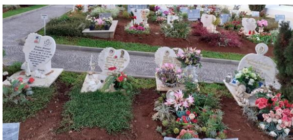
Figura 27: Pormenor de um dos espaços do cemitério onde ficam sepultadas as crianças “os anjinhos”

“No cemitério sempre tinha um pedacinho mais pequeno para enterrar as criancinhas, ainda hoje em dia se vê. Não era do tipo aqui enterrou-se uma pessoa grande, ao lado enterrava se uma criancinha. Não! Eles tinham sempre um cantinho no cemitério; ainda hoje em dia a gente vê lá um cantinho mas pequenino.” (E3)