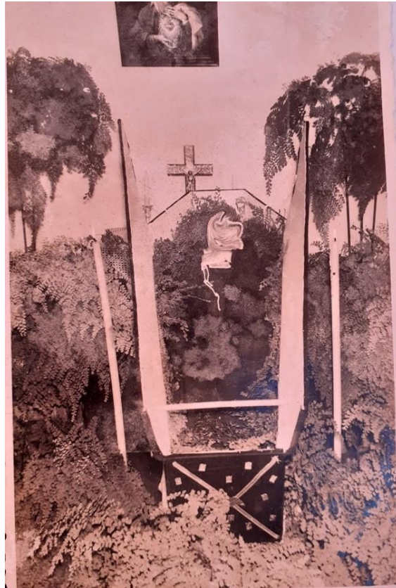
Figura 14: Velório nos Canhas, pormenor da sala enfeitada com avencas. Foto do fim dos anos 60, início dos anos 70