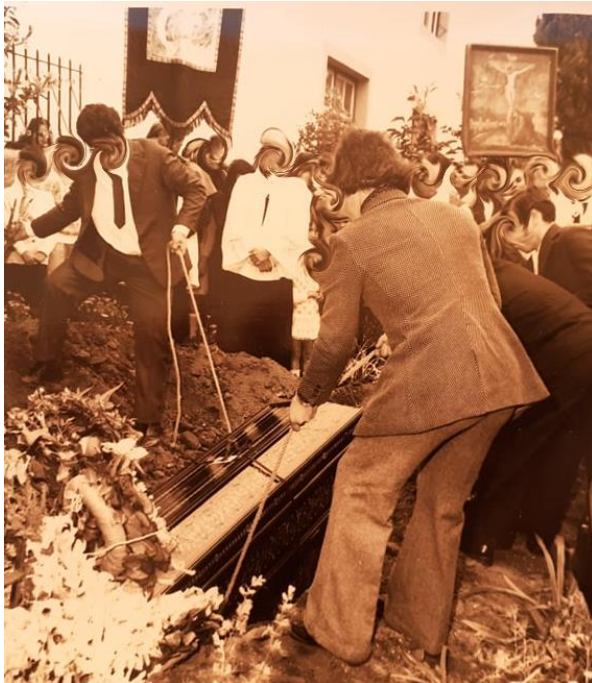
Figura 19: Outro pormenor de um funeral nos Canhas, onde se pode ver o quadro da Paixão de Cristo

Tanto a representação iconográfica da Paixão de Cristo como a bandeira das almas podem ser visualizados com mais pormenor na figura 19: