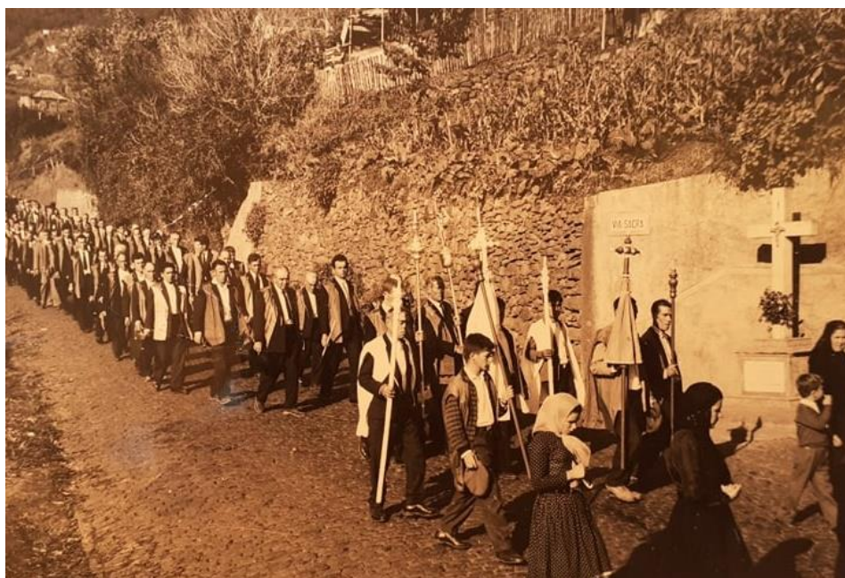
Figura 15: Homens e Irmãos da Mesa, depois da família enlutada

Nas figuras 15 e 16, é possível observar o ato da procissão e a sua divisão por género: em primeiro lugar, destacam-se os Irmãos da Mesa e os homens, seguindo-se as mulheres, sendo que aquelas que se vestiam de luto tinham prioridade relativamente às outras que envergavam outras cores.