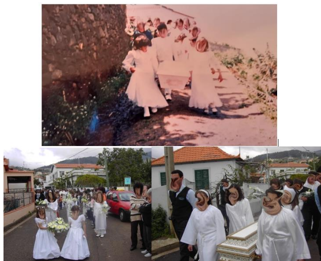
Figura 12: Funeral de um “Anjinho” nos Canhas, pormenor do caixão branco