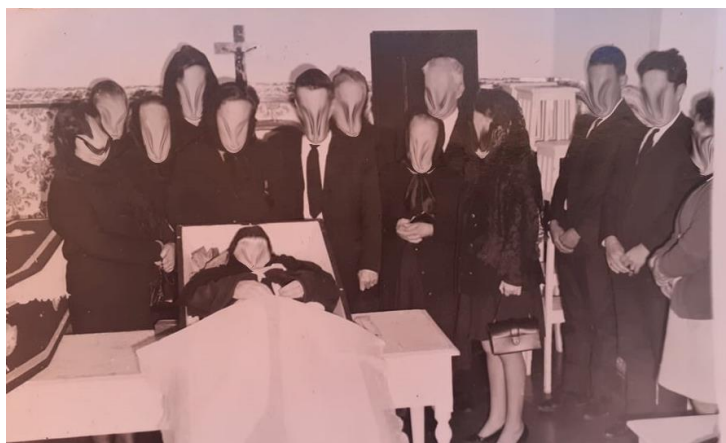
Figura 9: Velório numa casa da freguesia dos Canhas em finais dos anos 70

Na figura 9, é possível observar o velório de uma idosa na freguesia dos Canhas, no centro da sala principal da casa, de onde toda a mobília fora retirada, para que o corpo fosse o elemento central, para se proceder às devidas orações.