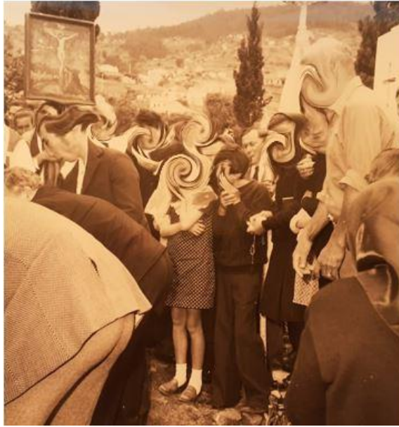
Figura 18: Funeral nos Canhas, com várias crianças em primeiro plano