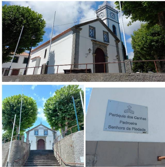
Figura 5: Exterior da Igreja de Nossa Senhora da Piedade

Ao longo dos anos, a igreja foi sofrendo vários restauros, tendo mesmo sido reerguida em 1753, por ordem do rei D. José, devido à sua destruição pelo terramoto de 1748. Esta é uma das igrejas mais ricas e históricas da ilha da Madeira, com destaque para as imagens da Nossa Senhora da Piedade, Nossa Senhora de Fátima e o Coração de Jesus.