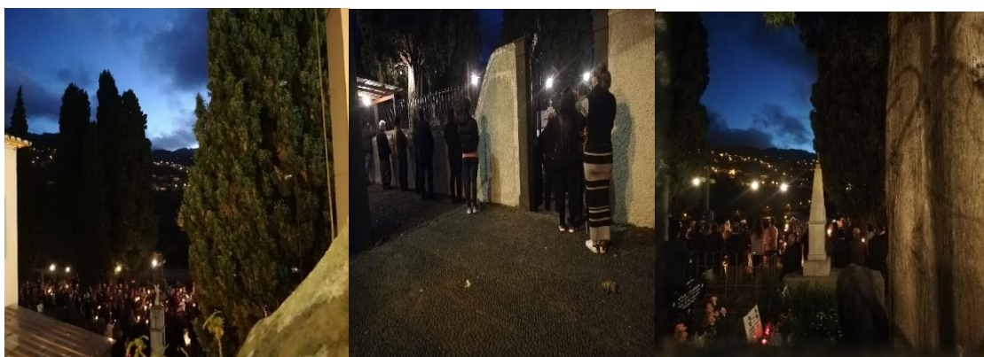
Figura 25: Pormenores da missa celebrada ao amanhecer no dia dos fiéis defuntos no cemitério

“No dia das almas, as pessoas costumam ir à missa quase sempre. Lembro-me que no tempo do Senhor Padre Miguel, ele dizia o nome de todas as pessoas que tinham morrido nesse ano e fazia uma oração. A missa passou a ser feita há uns 15 anos dentro do cemitério, ninguém ia à missa sem ser de preto e quem não ia de preto levava uma roupa escura. No dia das almas, as pessoas iam muito à missa, a missa nesse dia era sempre cedo para dar tempo às pessoas para poderem ir para casa fazer o seu dia de trabalho.” (E4)