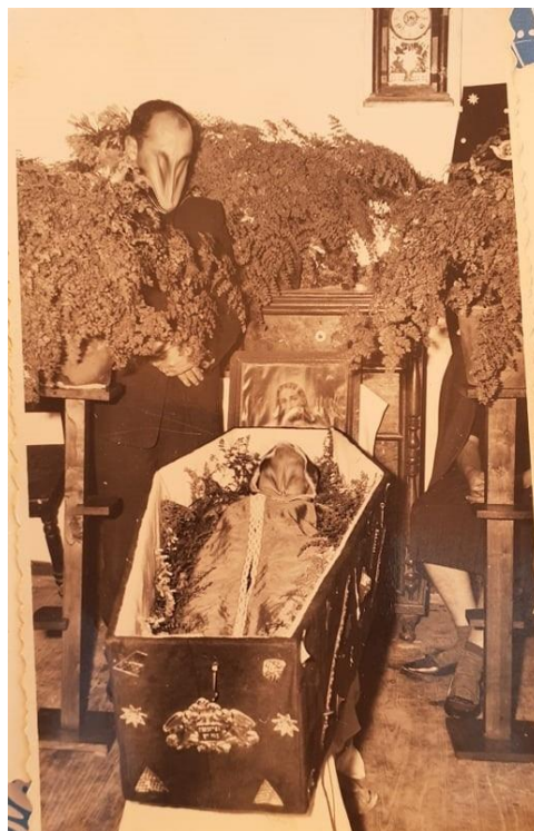
Figura 10: Velório em casa na freguesia dos Canhas, pormenor do caixão