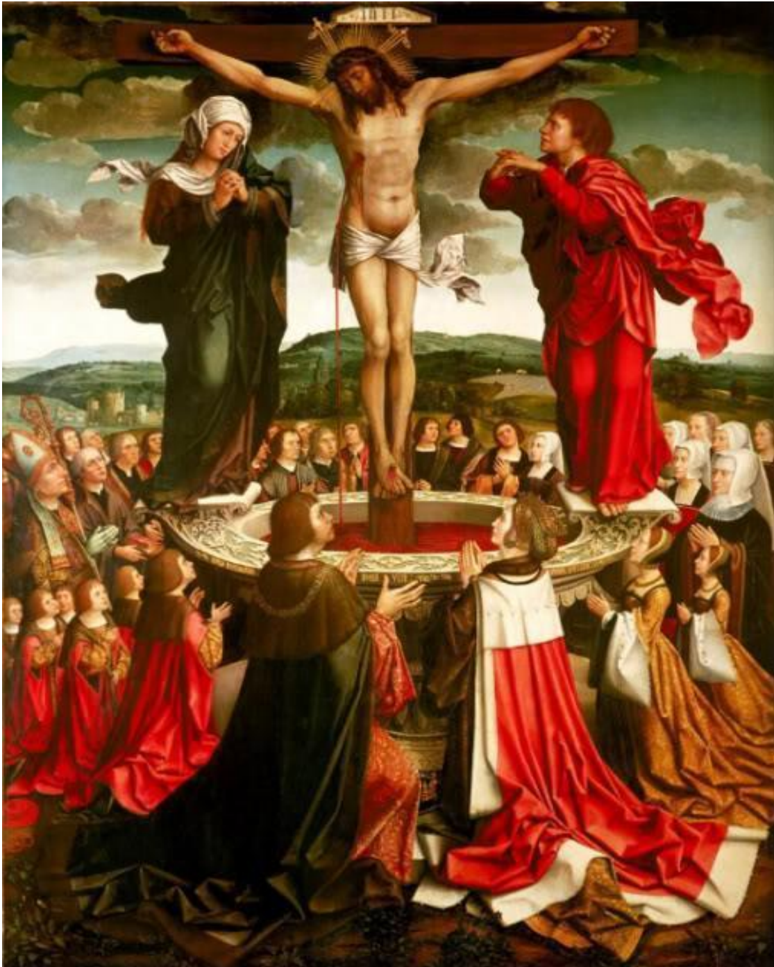
Figura 5. Fons Vitae , obra atribuída a Colijn de Coter.

Está datada de cerca 1515-1517 e nela D. Manuel é representado com a família.