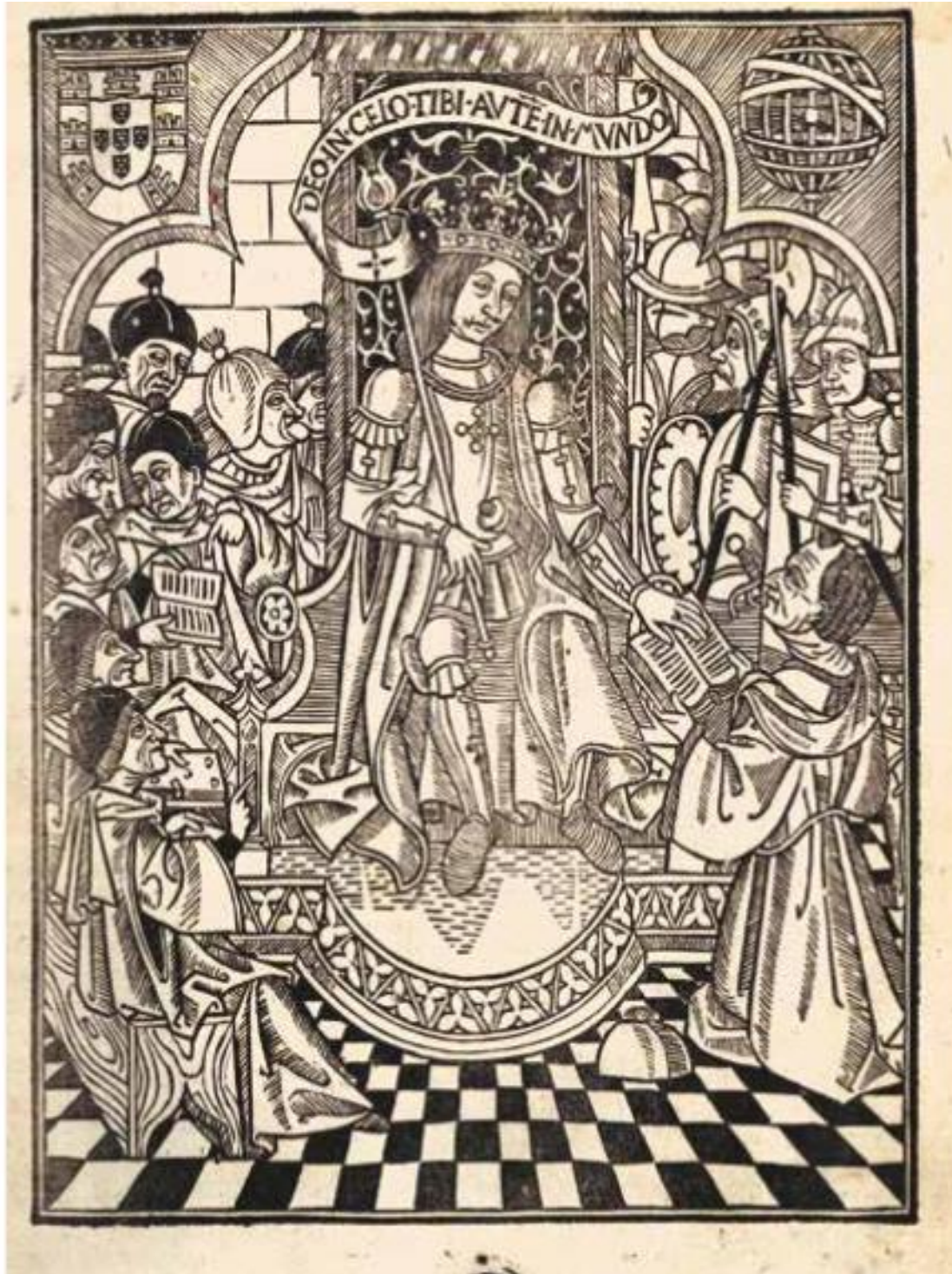
Figura 3. Gravura do I Livro das Ordenações Manuelinas

Imagem retirada do Catálogo da Exposição: Biblioteca das Cortes: 180 anos | Um olhar sobre as Ordenações