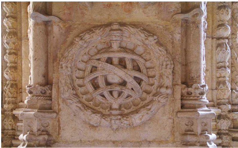
Figura 7. Esfera Armilar no Mosteiro dos Jerónimos