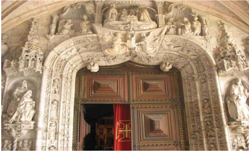
Figura 6. Portal principal do Mosteiro dos Jerónimos