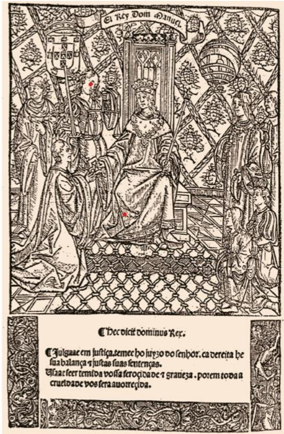
Figura 2. Gravura do V Livro das Ordenações Manuelinas